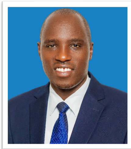
MHE. DKT. DOTO MASHAKA BITEKO (MB.) Naibu Waziri Mkuu na Waziri wa Nishati