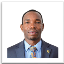
MHE. PATROBAS PASCHAL KATAMBI (MB.) Naibu Waziri wa Nchi, Ofisi ya Waziri Mkuu (Kazi, Vijana, Ajira na Wenye Ulemavu)