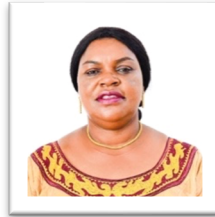
MHE. JENISTA J. MHAGAMA (MB.) Waziri wa Nchi, Ofisi ya Waziri Mkuu (Sera, Bunge na Uratibu)