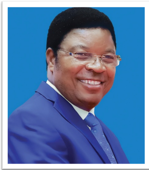
MHE. KASSIM MAJALIWA MAJALIWA (MB.) Waziri Mkuu wa Jamhuri ya Muungano wa Tanzania